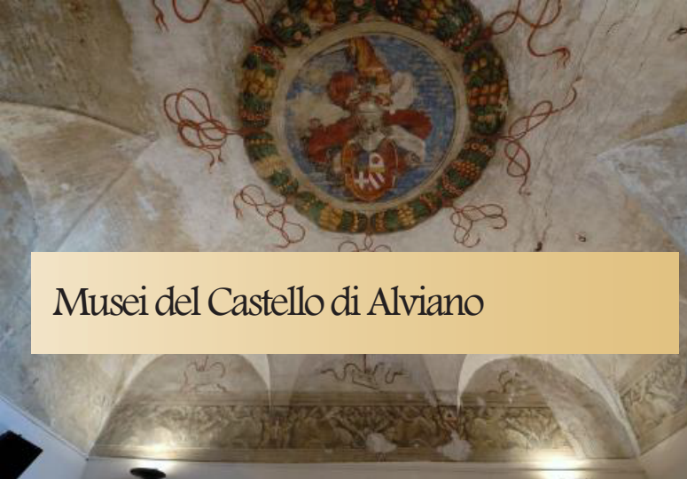
Musei del Castello di Alviano

L'elegante ed imponente Castello di Alviano, di fondazione medioevale e ricostruito sul finire del XV secolo, conserva intatte le caratteristiche di baluardo difensivo e di dimora signorile tipiche del Rinascimento. Attualmente, ospita nei sotterranei due musei di grande interesse: il Museo della civiltà contadina "La terra e lo strumento", testimonianza della vita rurale del territorio tra '800 e '900, e il Museo multimediale di Bartolomeo d'Alviano e i Capitani di Ventura umbri.