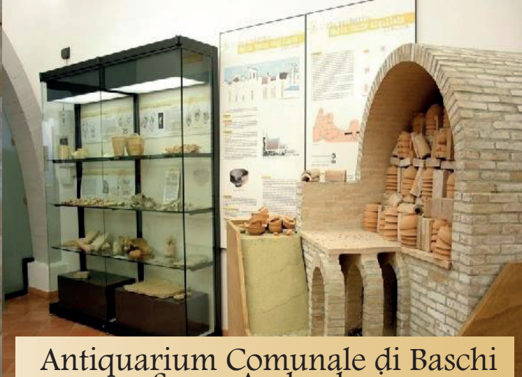
Antiquarium Comunale di Baschi e Scavo Archeologico di Scoppieto

L'elegante ed imponente Castello di Alviano, di fondazione medioevale e ricostruito sul finire del XV secolo, conserva intatte le caratteristiche di baluardo difensivo e di dimora signorile tipiche del Rinascimento. Attualmente, ospita nei sotterranei due musei di grande interesse: il Museo della civiltà contadina "La terra e lo strumento", testimonianza della vita rurale del territorio tra '800 e '900, e il Museo multimediale di Bartolomeo d'Alviano e i Capitani di Ventura umbri.