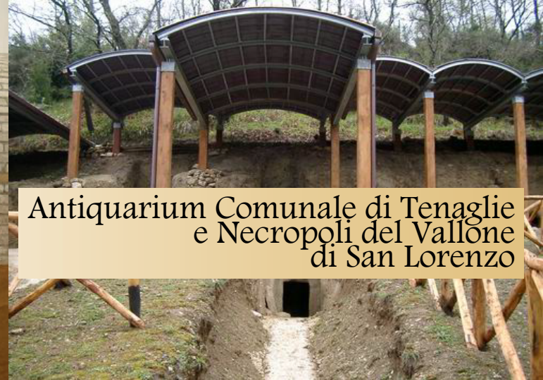
Antiquarium Comunale di Tenaglie e Necropoli del Vallone di San Lorenzo

Nel 1995 gli scavi condotti dall'Università di Perugia in località Scoppieto di Baschi hanno riportato alla luce un complesso produttivo unico al mondo: una fabbrica di ceramica fine da mensa del I secolo d.C., la Terra Sigillata Italica. I manufatti erano di gran pregio e dopo esser stati prodotti a Scoppieto venivano, grazie alla vicinanza di questo luogo con l'importante via di comunicazione che era a quel tempo il fiume Tevere, commercializzati in tutto l'Impero Romano. I reperti archeologici rinvenuti in questo scavo sono custoditi presso l'Antiquarium di Baschi, e disposti secondo un itinerario di visita organizzato in sezioni.